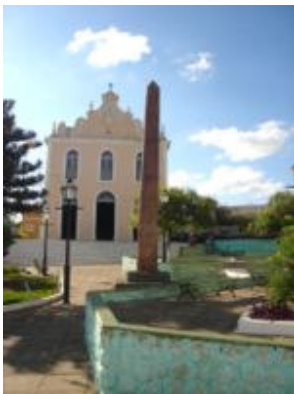
Igreja da cidade de Areia

O povoado foi elevado à categoria de vila em 30 de agosto de 1818 e, em 18 de maio de 1846 , tornou-se cidade.